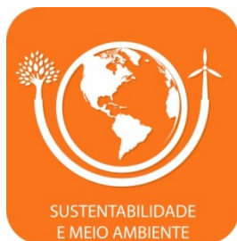
SUSTENTABILIDADE E MEIO AMBIENTE