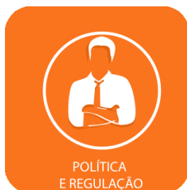
POLÍTICA E REGULAÇÃO

O governo de Pernambuco lançou o programa PE Solar, com o objetivo de incentivar o uso da energia fotovoltaica por micro, pequenas e médias empresas pernambucanas. O programa assegura uma linha de financiamento específica para instalação de painéis fotovoltaicos. Na primeira fase, serão disponibilizados R$ 5 milhões de recursos do Banco do Nordeste. O decreto que institui o programa foi assinado na última sexta-feira, 29 de maio, pelo governador Paulo Câmara, em solenidade no Palácio do Campo das Princesas, em Pernambuco. O secretário de Desenvolvimento